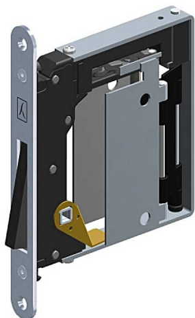
mod. 937 WC

Serratura 938 Mini B-no-ha Rasomuro Cromo Satinato